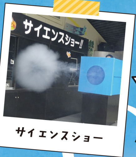
サイエンスショー